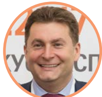
Александр Морозов Заместитель Министра Минпромторг РФ