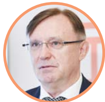
Сергей Когин Генеральный директор КАМАЗ

Текущая и стратегическая государственная политика в отношении коммерческого транспорта