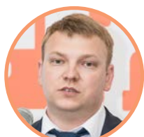
Вячеслав Бурмистров Замдиректора департамента технического регулирования и аккредитации ЕЭК